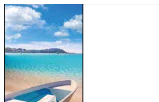
1/1 Seite 210 x 270 mm