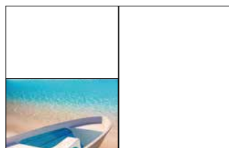
1/2 Seite quer 210 x 135 mm