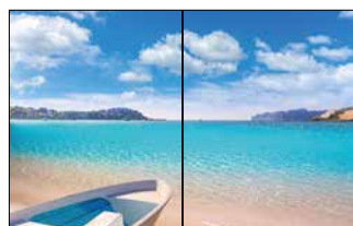
Panorama (Doppelseite) 420 x 270 mm