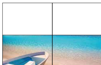
1/2 Doppelseite 420 x 135 mm