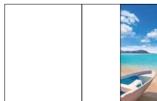
1/2 Seite hoch 105 x 270 mm