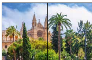
Panorama (Doppelseite) 420 x 270 mm