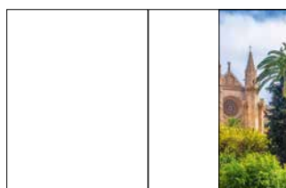
1/2 Seite hoch 105 x 270 mm