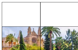
1/2 Doppelseite 420 x 135 mm