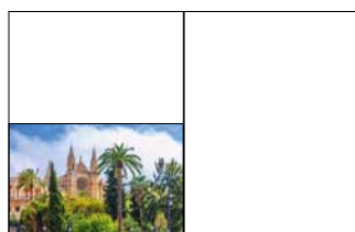
1/2 Seite quer 210 x 135 mm